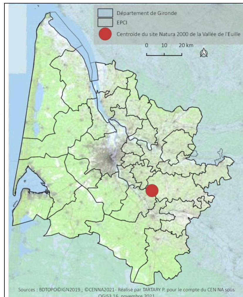
Figure 1 : Localisation du site Natura 2000 de la Vallée de l'Euille (TARTARY P., 2021)

Le présent bilan d'animation couvre la période allant de février 2024 à février 2025.