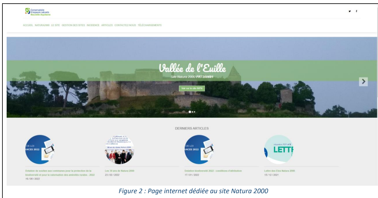
Figure 2 : Page internet dédiée au site Natura 2000

Il est important de noter que ce site est transférable en cas de changement d'animateur. Le site est opérationnel depuis début 2021 et