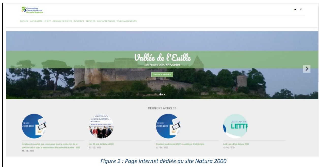
Figure 2 : Page internet dédiée au site Natura 2000

Il est important de noter que ce site est transférable en cas de changement d'animateur. Le site est opérationnel depuis début 2021 et